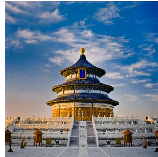
Beijing, Capital chinoise