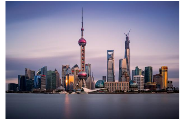
Shanghai, la plus grande métropole chinoise