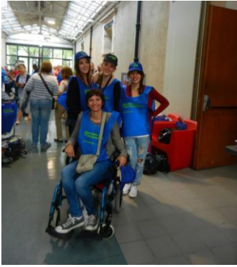
En route pour les recensements !