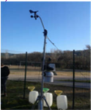
Station météo de Zola